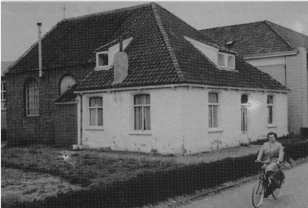
1970, het oude kerkje is nu jeugdhuis.

Vanaf februari 1825 konden de Hervormden hun bijeenkomsten houden in het kerkje in de Schoolstraat 8.